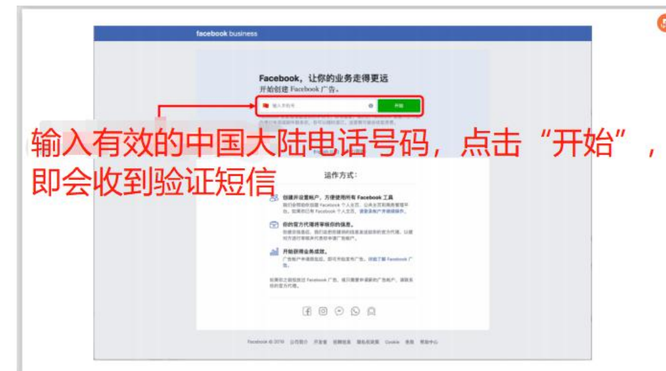
步骤 2-2： 进行开户申请