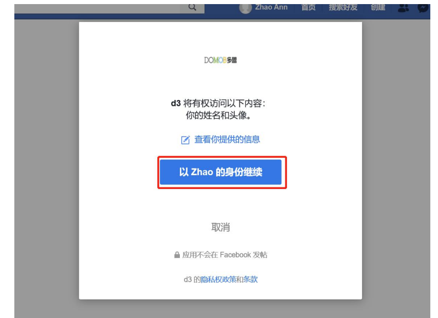
步骤 1-2： 进行 Facebook 账户授权